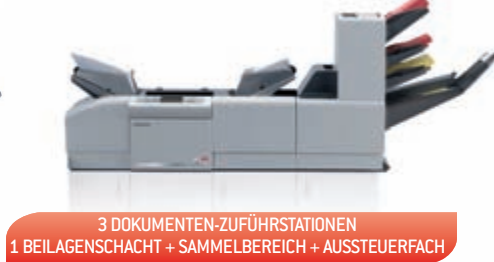
3 DOKUMENTEN-ZUFÜHRSTATIONEN 1 BEILAGENSCHACHT + SAMMELBEREICH + AUSSTEUERFACH