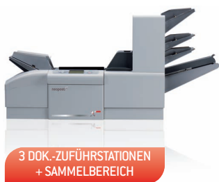
3 DOK.-ZUFÜHRSTATIONEN + SAMMELBEREICH

Durch den modularen Aufbau der DS-100 brauchen Sie sich bei der Anschaffung nicht den Kopf darüber zu zerbrechen, welche Anforderungen das System langfristig zu erfüllen hat. Erwerben Sie zur gegebenen Zeit einfach den richtigen Systembaustein hinzu – passend zum Wachstum Ihres Unternehmens. Diverse optionale Funktionen erschließen Ihnen größere Auftragsvolumen und steigern die Produktivität. Durch den modularen Aufbau des Systems ist die Kosteneffizienz Ihrer Anlageinvestition heute genau so wie in Zukunft gewährleistet.