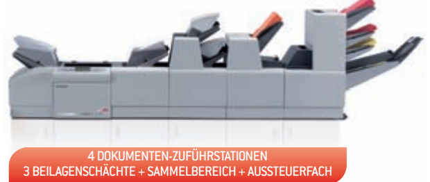
4 DOKUMENTEN-ZUFÜHRSTATIONEN 3 BEILAGENSCHÄCHTE + SAMMELBEREICH + AUSSTEUERFACH